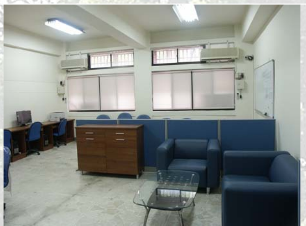
圖三、碩士在職專班研究室

◆ 研究所空間改善 ：系館 1 樓碩士在職專班研究室之整修工程已完工（見圖三）。目前有一些師門研究室，因放置待報廢財產，或因退休老師之師門學生尚未畢業，導致空間不足使用的情形發生。系辦已著手協調處理，敬請受影響的老師及其師門包涵。