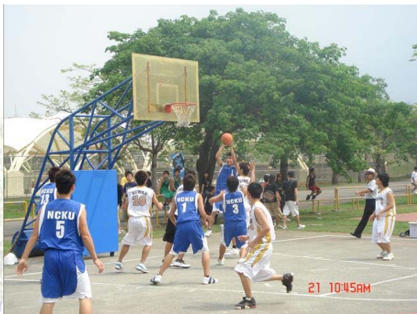
圖四、激烈的籃下之爭