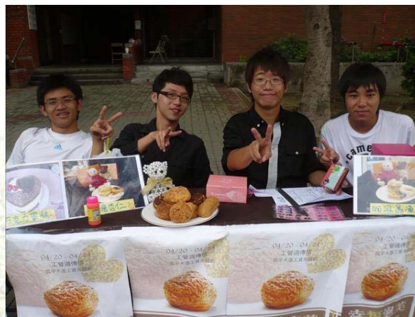
圖六、幸福泡芙等你來傳情喔～ (本文由系學會提供)