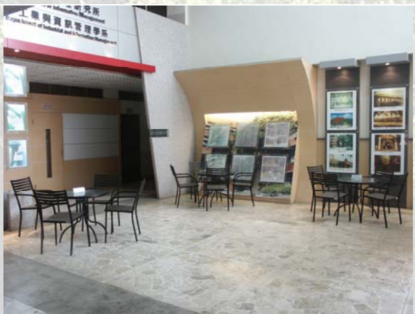
圖一、一樓中庭現況