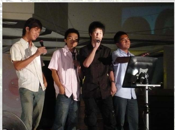
圖五、冒牌 F4 笑翻全場！

◆工管週活動現正熱烈進行中，歡迎各位同學踴躍參加！如果你已經錯過笑聲不斷的卡拉 OK 大賽、瘋狂的賭城風雲，趕快把握以下機會：