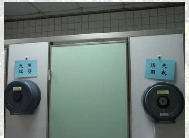
圖二、廁所衛生紙架標示