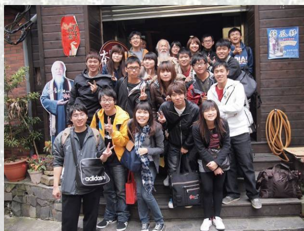
與奮起湖便當創始人合照

第一天大家浩浩蕩蕩從光口出發，一路騎到了奮起湖享用午餐，大家騎了一整個早上的車，坐的屁股都麻了，一有休息機會一定馬上跳下車活動活動筋骨，若說到奮起湖，最有名的當然就是馳名中外的火車便當啦，雖然說奮起湖便當現在在你我的好鄰居 7-11 都吃的到，但來當地品嚐正宗原味的便當可說是別有另外一番風味，而且便當的創始人還到處招攬生意與遊客合照呢！