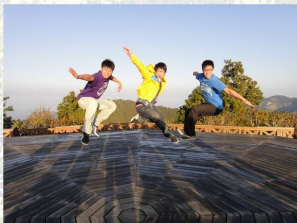
最新爆紅男子團體

還好沒有枉費大家辛辛苦苦的兩點起床，我們運氣很好遇到了好天氣，更來到獨家私人觀日出景點—小笠原觀日平台，這邊不用跟滿滿的人擠在一起，更有著 360° 的絕佳環繞視野，使日出完全一覽無遺啊！看到了日出感動的瞬間，我們更在舞台上拍起了專輯封面，在這樣的機緣下，新生代爆紅男子團體誕生了！