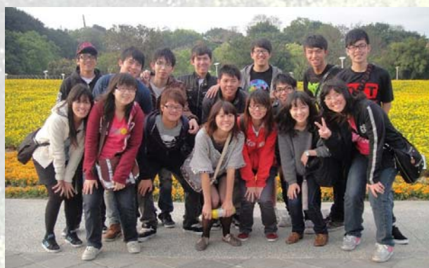
花博花海前的合影