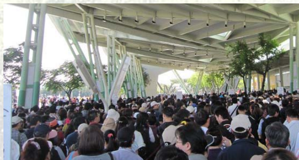
人山人海的花博入口