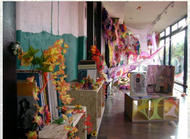
蔡忠翰 林秉錚 黃采緹撰文