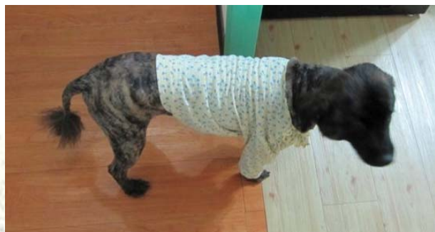
仲廷家剛剃完毛的 lucky