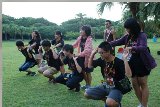
在鵝鑾鼻公園跳交朋友舞的家爸媽們