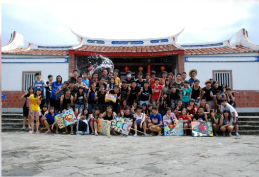
生存遊戲完的合照，還可以看到後面工人”正在”潑水的奇觀