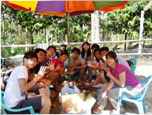
在烤肉的四家成員們