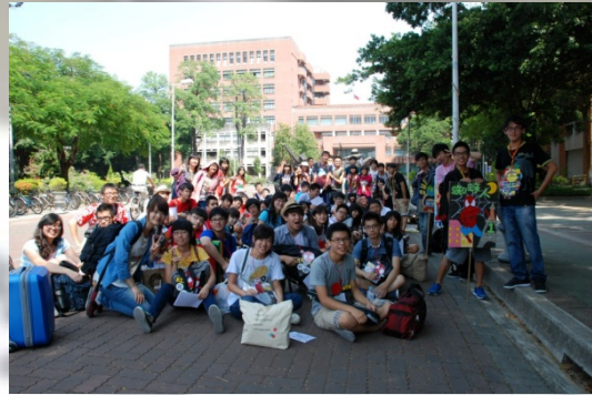
在啟程前的大合照