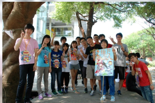
在成大練家隊呼的二家成員們