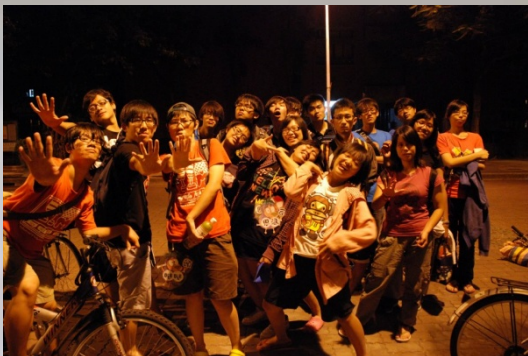
在迎新宿營活動結束後，家爸媽和生活機工人大合照