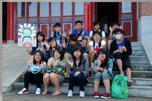
在墾丁青年中心的三家合照