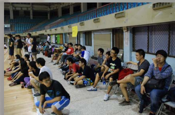
在場邊蓄勢待發的大家