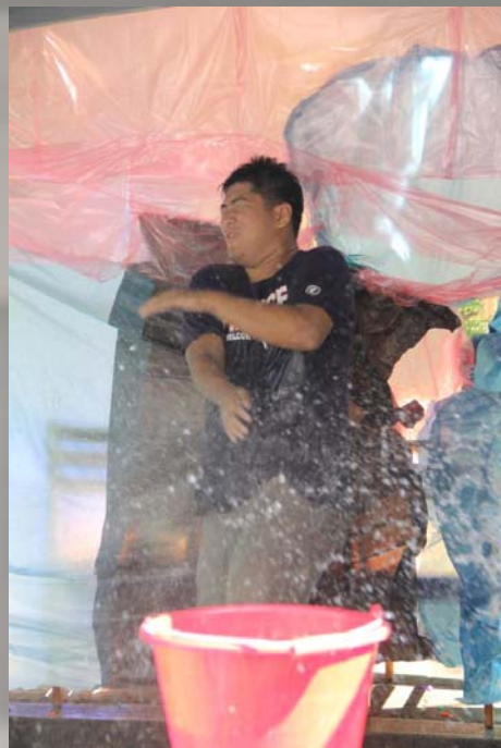
遭受水球攻擊的建業

而遊戲方面，經過上次叫好叫座的經驗，這次不例外的仍有砸水球的刺激遊戲，無可避免的，我們重量級的建業成了最受好評的目標，在活動股員的犧牲自爆下，水球在中午前就驚人的砸完了！