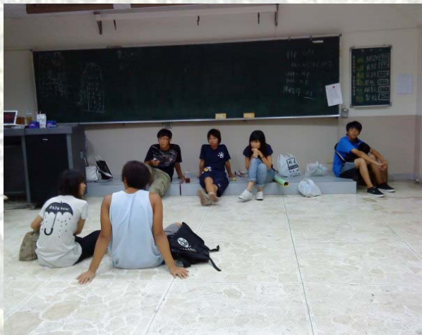
大家正拼命的排戲中

爲了讓 102 的學弟妹更快的能融入這個溫馨的大家庭，也爲了讓學長姐更認識學弟妹。希望學弟妹能藉由這個活動更瞭解往後營隊相關活動和大學生活。