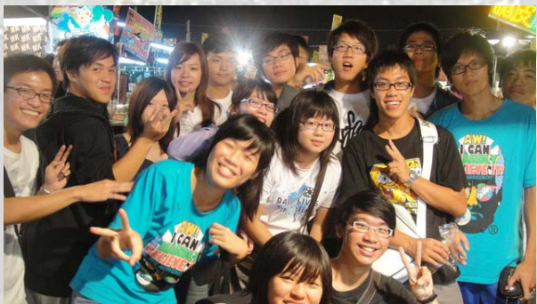
處於競爭狀態的第六家第七家大合照，喇叭(右上三)露出挑釁的表情！

完成了第一階段的食物接龍後，回到主持人所在的根據地進行一場歡樂的小遊戲後獲得了第二階段的任務內容：主持人提供的數張照片，