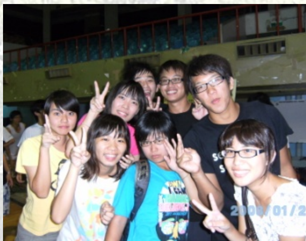
阿鬼是在幹麼阿 真的是很受不了.....

比賽中快速的直球、旋球，你來我往，真是驚險刺激，不過當然也有比較輕鬆一點的老人球，桌球真可說是一個老少咸宜的運動。102級學弟妹威猛的實力嚇死學長姐了，害我們只能都躲角落，不過乖巧的學弟妹在拿到果凍和餅乾的獎品後，還會貼心地孝敬學長姐，也算是不錯啦！！