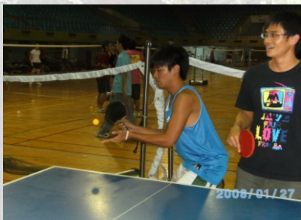
哇賽！好翹的屁股.. 資祥想幹麻！！??

比賽中快速的直球、旋球，你來我往，真是驚險刺激，不過當然也有比較輕鬆一點的老人球，桌球真可說是一個老少咸宜的運動。102級學弟妹威猛的實力嚇死學長姐了，害我們只能都躲角落，不過乖巧的學弟妹在拿到果凍和餅乾的獎品後，還會貼心地孝敬學長姐，也算是不錯啦！！