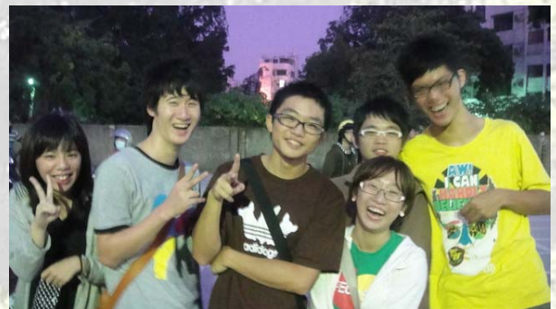
在勝後集合時的拍照，大家都相當期待晚上的賈方的茉莉花園

■「賈方的茉莉花園」---花園夜市的食物接龍 九十八學年度上學期系會活動股的第一個活動：「賈方的茉莉花園」就在 10 月 22 日星期四晚上開始了。系會舉行這個活動的意義在於希望能帶剛進來的 102 級小大一在台南最大的花園夜市能盡情的吃喝玩樂，以及藉由這次系會活動股所舉辦的活動，使得工資管系這個大家庭相處得更快樂更融洽！