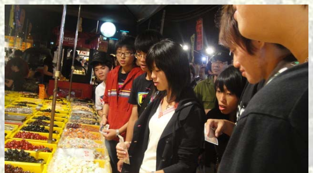
被夜市店家琳琅滿目的食物看傻了眼，真想每樣都試試看！

花園夜市除了各式各樣的美食外，也有各種不同的遊戲設施，如套圈圈、排麻將、射氣球、射飛鏢。吃累了也可以去玩樂一下，玩完了也餓了就再去吃，這就是夜市的好玩之處。這次在花園夜市舉辦的「賈方的茉莉花園」完美的結束，感謝系上各位支持，也感謝活動股辦活動的努力！