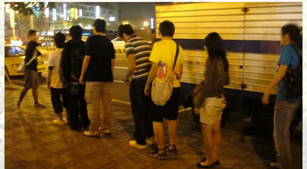
完成第一階段任務後，在主持人這裡進行跳繩小關卡，要跳過十下才能獲得第二階段的任務喔！

都是花園夜市裡著名的店家一隅，根據這些照片找到照片內的店家並且品嚐店內的美食，最快找到所有照片內的店家的那組就是優勝組。