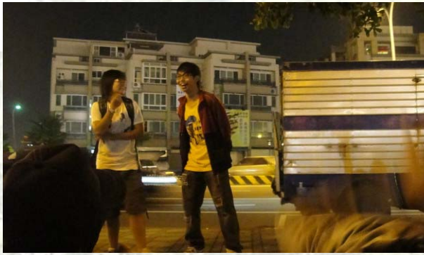
兩位主持人的開場狀況劇，令台下的人瘋狂大笑

花園夜市雖然美食飲料眾多，但是為了能完成主持人所指定的任務，各組裡的每個人無不絞盡腦汁的想哪道菜可以繼續接下去，「剛剛吃完了雞蛋糕，要吃糕(或跟糕同音)開頭的什麼料理才能接到芝麻呢？」等類似句子，都在各組內激烈的討論。雖然大部分的組別一道食物可能只點兩到三份，但是所有食物累積起來也夠整組的人在這場遊戲中填飽肚子。