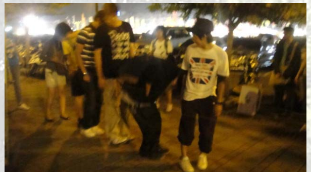
到底！是！誰！踩！到！了！跳！繩！