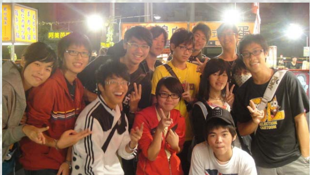
正在進行第一階段遊戲的第六家，悠閒的接受拍照，看來最後不會贏啦！

花園夜市雖然美食飲料眾多，但是為了能完成主持人所指定的任務，各組裡的每個人無不絞盡腦汁的想哪道菜可以繼續接下去，「剛剛吃完了雞蛋糕，要吃糕(或跟糕同音)開頭的什麼料理才能接到芝麻呢？」等類似句子，都在各組內激烈的討論。雖然大部分的組別一道食物可能只點兩到三份，但是所有食物累積起來也夠整組的人在這場遊戲中填飽肚子。