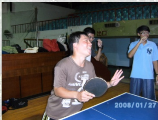
呵呵.蘇伯都不好意思了.... >////<,顯懷是蕙慈上身嗎？！

除了能夠肆無忌憚的打球外，現場還有提供免費的飲料供大家無限暢飲。此外，主辦單位還很貼心的提供獎品給優勝的隊伍，真是太棒了，不僅可以喝可以玩，還有獎品可以拿，簡直物超所值！