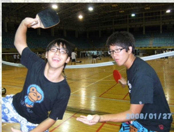
打球打到三太子上身== 實在是很努力耶..

最後，經過激烈的戰鬥，黃金鐵六腳、籃球隊、群擺搖搖、瑪莉隊，這四個隊伍取得晉級的機會，又是一番天崩地裂的廝殺之後，終於，確定了這一屆系砂鍋的冠軍隊伍—瑪莉隊，亞軍—籃球隊，季軍—群擺搖搖，而黃金鐵六腳則是得到殿軍。雖然比賽有輸有贏，但卻是在和平又歡樂的氣氛中圓滿結束這次的桌球系砂鍋比賽！