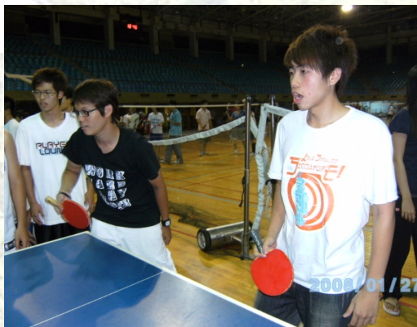
第一次參加系砂鍋的學弟妹耶！好認真阿～蚊子都飛進嘴巴啦！

除了能夠肆無忌憚的打球外，現場還有提供免費的飲料供大家無限暢飲。此外，主辦單位還很貼心的提供獎品給優勝的隊伍，真是太棒了，不僅可以喝可以玩，還有獎品可以拿，簡直物超所值！